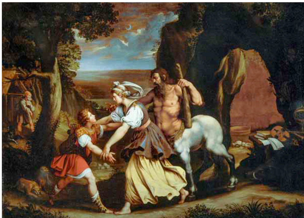
Bernardino Cesari (Arpino, Frosinone 1565 - Roma 1621) Achille incontra Teti presso il centauro Chirone secondo decennio del XVII secolo olio su tela, cm. 70 x 100